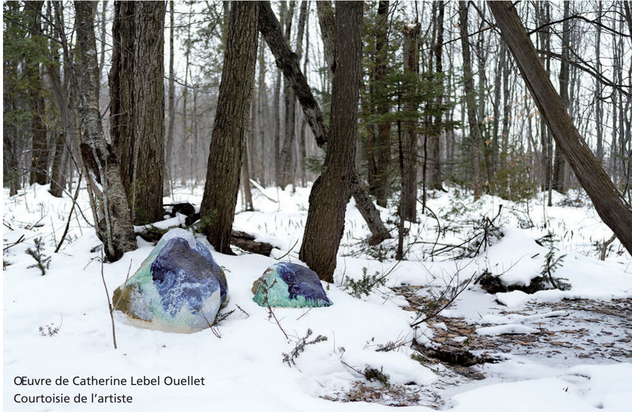
Œuvre de Catherine Lebel Ouellet

Une première exposition est présentée dans le cadre des activités satellites de Manif d'art 11, la biennale de Québec.